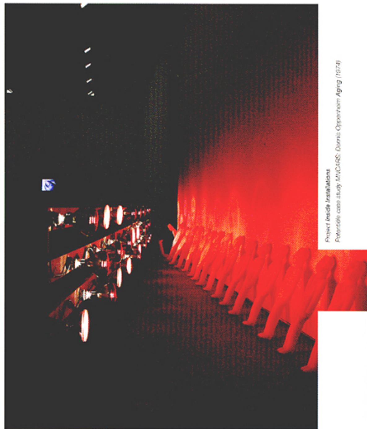
Project Inside Installations Potentiële case study MNCAPS: Dennis Oppenheim Aging (1974)

Kunstenaarsfilms vormen een aparte categorie in de collecties van musea voor moderne en hedendaagse kunst. Ze vragen om een eigen aanpak als het gaat om beheer en behoud. Een kunstenaarsfilm is niet alleen een museaal object, maar kan ook gezien worden als een drager van specifieke rechten op het gebied van eigendom, reproductie en vertoning. Waar liggen de overeenkomsten en verschillen ten opzichte van speelfilms, documentaires en ander filmmateriaal? Hoe ga je als conservator/restaurator om met de specifieke eisen, mogelijkheden en problemen rond kunstenaarsfilms? De SBMK organiseerde als startpunt voor dit project een bijeenkomst over dit onderwerp in het auditorium van Museum Boijmans Van Beuningen. Centraal stonden voorbeelden en vragen uit het veld, de visies van