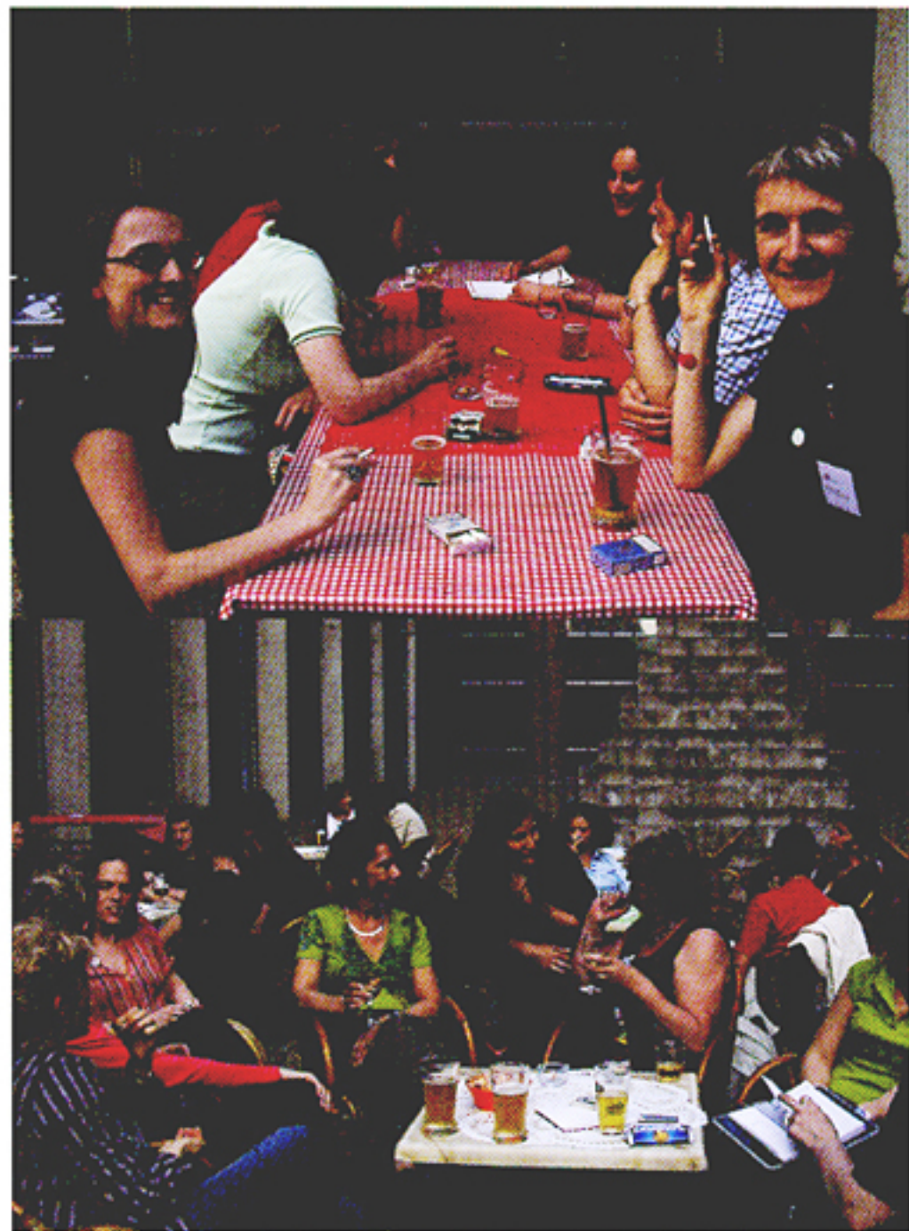
Project Inside Installations